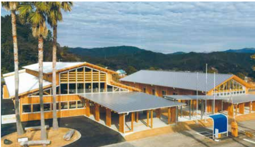
まぜのおか 管理棟・交流棟

耐久性のある素材を用いた、現代感覚にマッチしたシャープな金属屋根です。住宅・店舗・学校・工場など幅広い用途に適します。